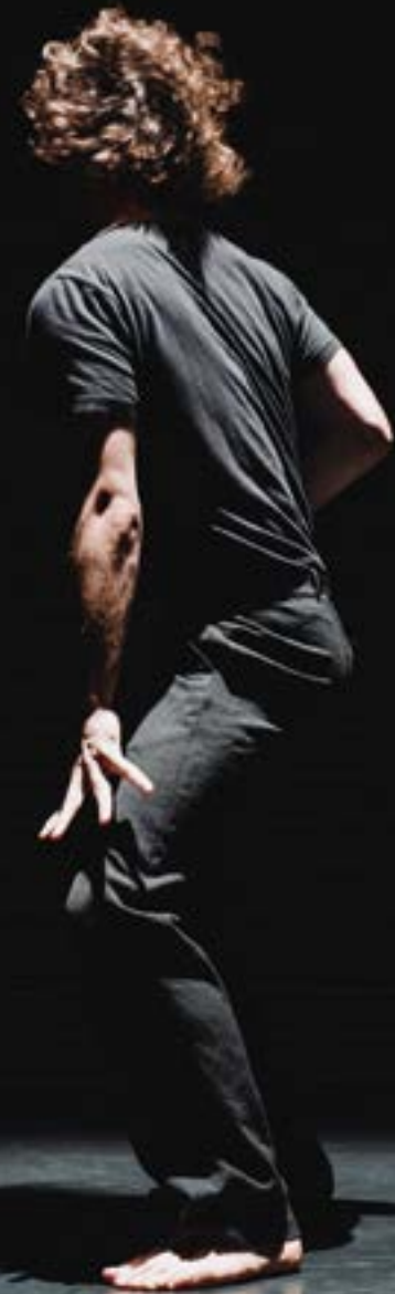
Today's mue - Esteban Appesseche