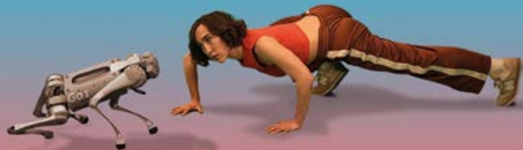
Jésus est sur Tinder - Rodrigo Garcia