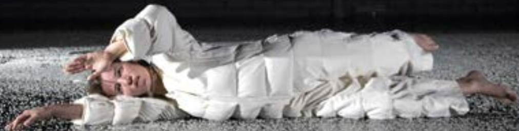
Shed me - Philomène Jander